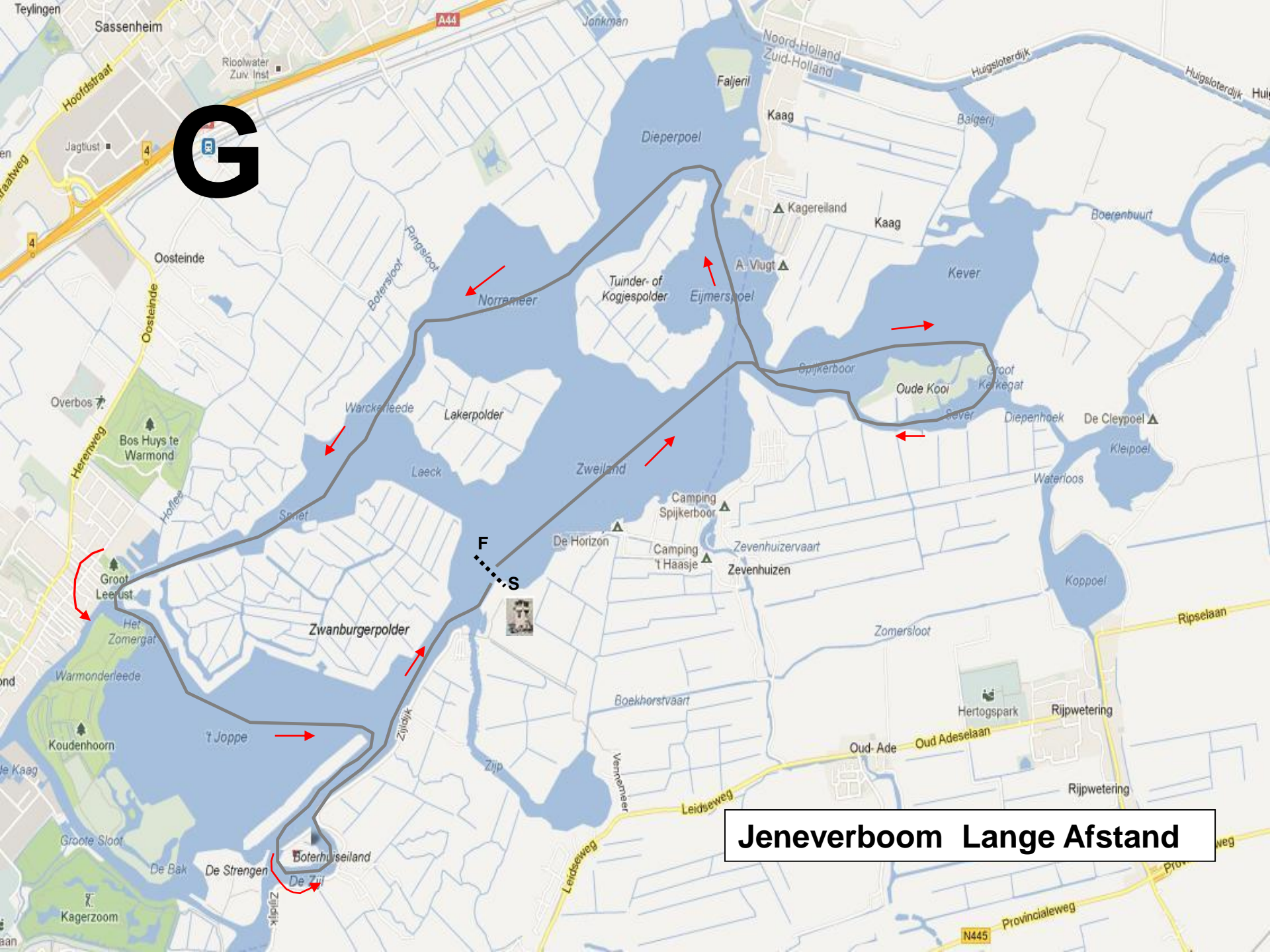
Jeneverboom Lange Afstand