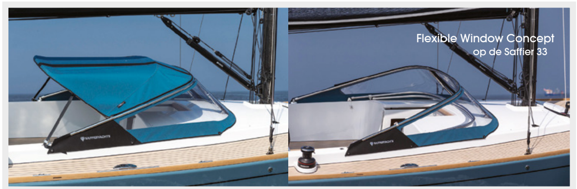
Flexible Window Concept op de Saffier 33

Buiskappen Dekzeilen Bimini's Hoezen Bootkussens Reparaties