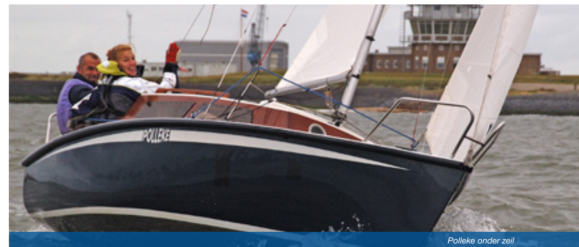
Polleke onder zeil