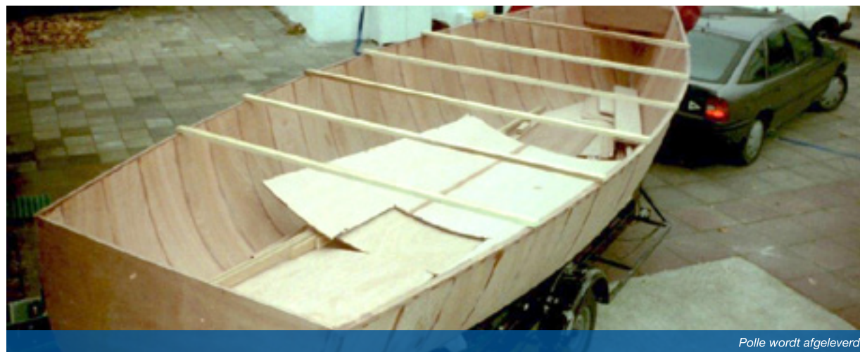
Polle wordt afgeleverd