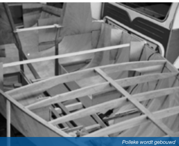
Polleke wordt gebouwd

In 1979, zijn we voor het eerst met Polleke naar het voormalige Joegoslavië geweest. De Polleke op een geleende trailer, twee en een halve dag rijden en 's nachts er in slapen, naar Zadar rijden, daar te water en dan drie weken zeilen op de Adriatische zee. Prachtig was dat! Door het mooie weer was je boot veel groter want de kinderen sliepen vaak in de kuip of op de wal. Ik heb daarna zelf een trailer aangeschaft en wij zijn tot de oorlog daar met vakantie geweest. Wij