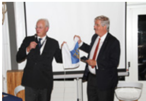
De vlag wordt symbolisch overgedragen