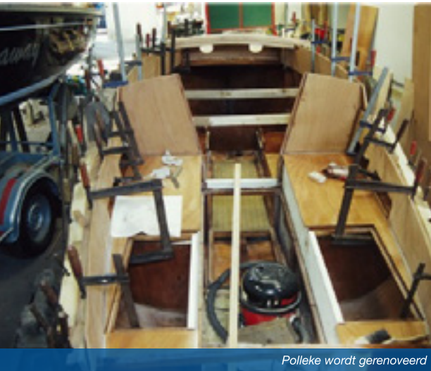
Polleke wordt gerenoveerd

hebben met de Polleke de kust en de eilanden tot aan Dubrovnik verkend. De eerste jaren dat wij daar waren konden we soms wel een dag varen voor je iemand tegen kwam, maar wij hebben het daar ook veel drukker zien worden.