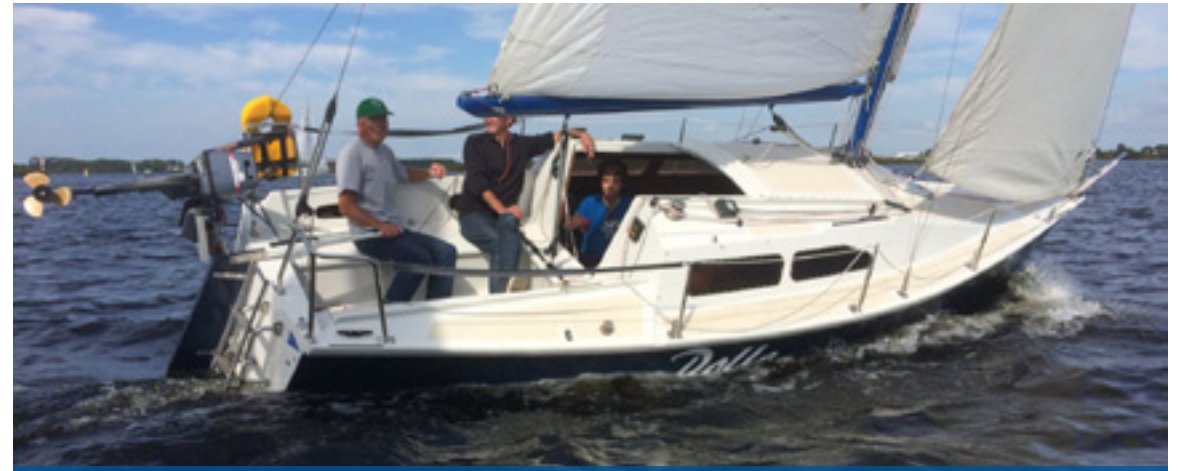
Polle tijdens de 8 uren op de Kaag 2016

Sweilandstraat 7a - 2361 JA Warmond - 071-3010378 - info@lockhorst.nl - www.lockhorst.nl