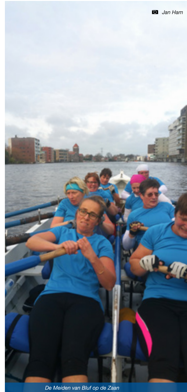
De Meiden van Bluf op de Zaan

In één woord verrassend, de sprintwedstrijd op de Zaan! Ik mocht mee als stuurman en de meiden waren goed op elkaar inge-