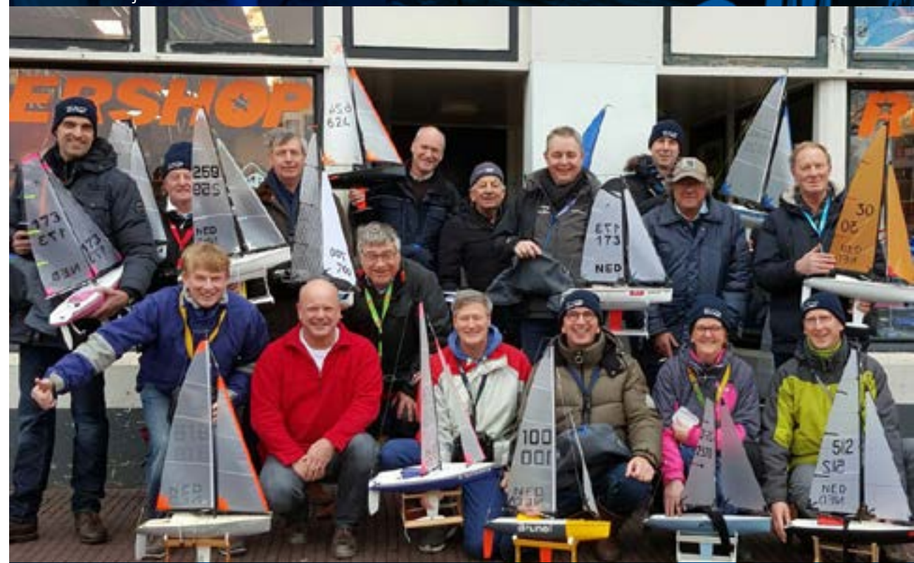
Groepsfoto in de Leidse binnenstad, met de eigenaar van de Vliegershop in het midden.