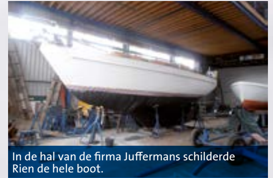
In de hal van de firma Juffermans schilderde Rien de hele boot.

In het tussenliggende jaar gaan we niet naar Scandinavië, maar doen we mee aan de tweejaarlijkse Dutch Classic Yacht regatta. De Vindö is inmiddels een erkende Polyklassieker geworden.