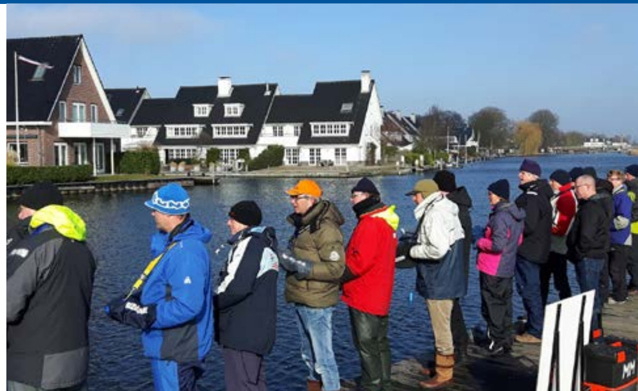
Thuiswedstrijd aan de Leede.

Of het nu 25 jaar Vliegershop was of dat we er 10 jaar als gast komen was me niet helemaal duidelijk, maar wel was het dit keer met uitgebreid koffie / thee en ►