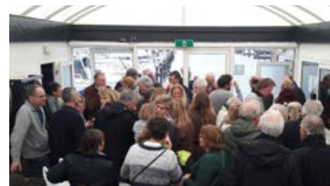
De roeiers vulden ook de hal van 't Lichthuys.