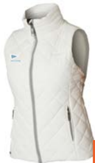
Salt Shaker - women