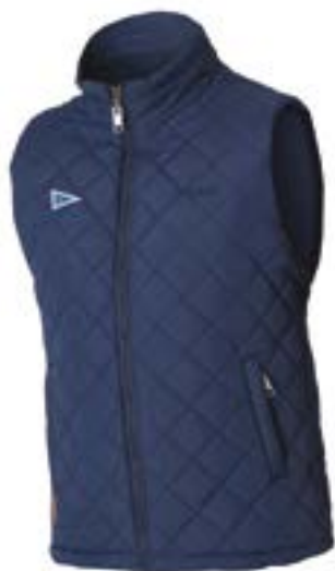
Cool Breeze - men