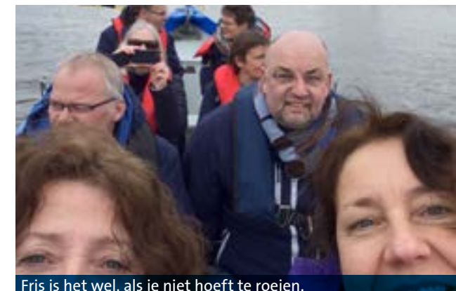
Fris is het wel, als je niet hoeft te roeien.