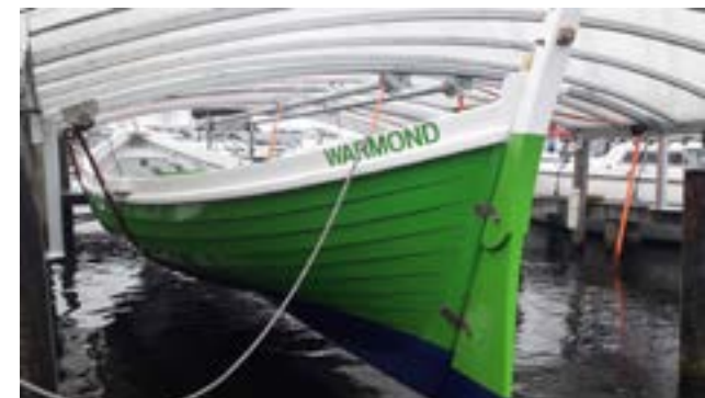
Voortaan worden de whalers uit het water getild.