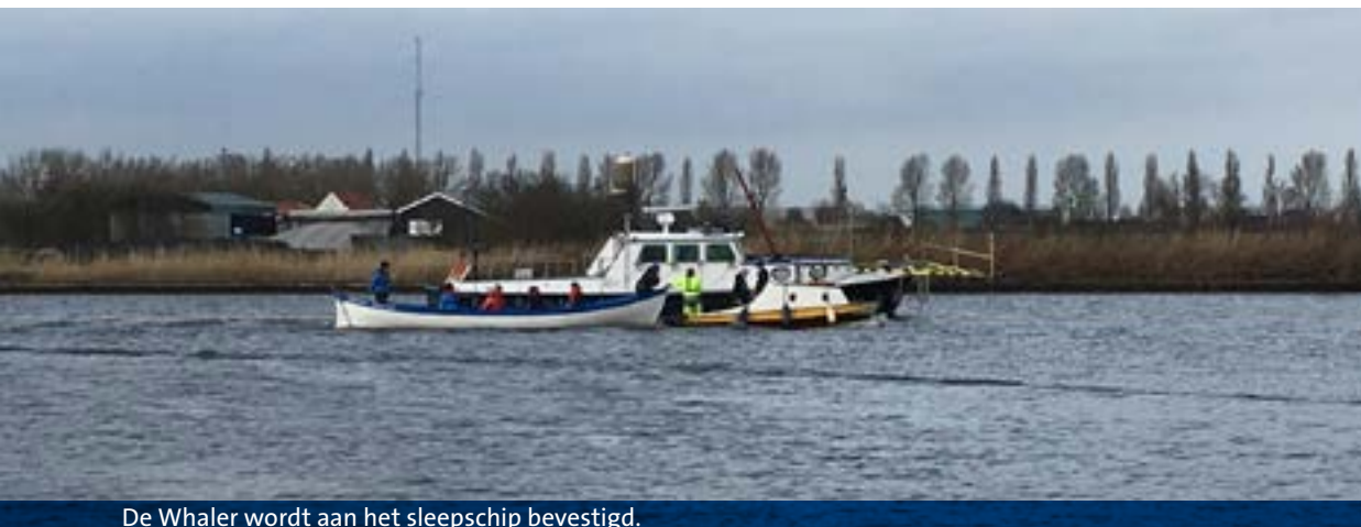
De Whaler wordt aan het sleepschip bevestigd.