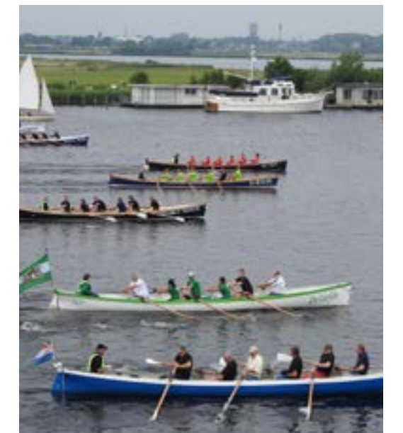
Gig-start bij de Kaagrace.

De voorbereidingen zijn alweer begonnen voor de race op de 2e zaterdag in juni. Voor de elfde keer organiseren we deze landelijke roeiwedstrijd voor Whalers en Gigs. Vorig jaar, tijdens het tweede lustrum, deden ruim honderd sloepen mee. Kom, ook als je zelf niet roeit, zeker kijken. Het belooft weer een groot festijn te worden.