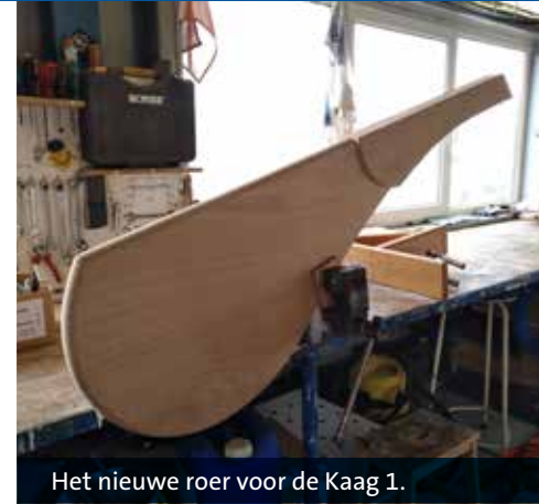
Het nieuwe roer voor de Kaag 1.