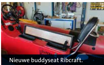
Nieuwe buddyseat Ribcraft.