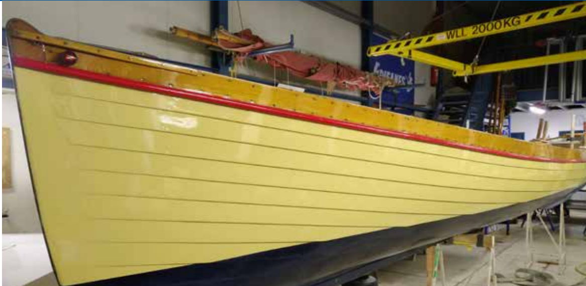
De Neptunus glimt weer als een spiegel.