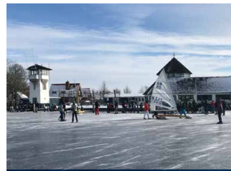
Ouderwetse gezelligheid bij de Kaagsociëteit