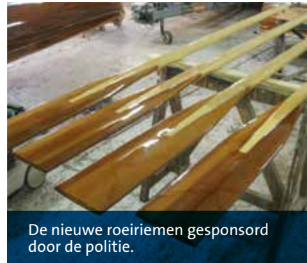
De nieuwe roerriemen gesponsord door de politie.