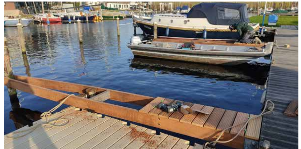
Een aantal nieuwe vingersteigers haven West.