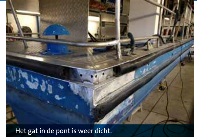
Het gat in de pont is weer dicht.