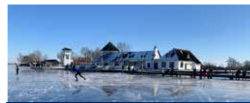
In alle vroegte is het nog rustig schaatsen.