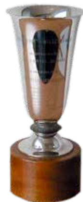
Willger beker, deze beker wordt aan de 12voetsjollen uitgereikt tijdens de Kaagweek.

Wat hadden we verleden jaar graag het 110-jarig bestaan van de vereniging met u gevierd. En wat te denken van heropening van de gerenoveerde Kaagsociëteit? 2020 was met recht een kroonjaar waarbij een andere "Croon" roet in het eten strooide.