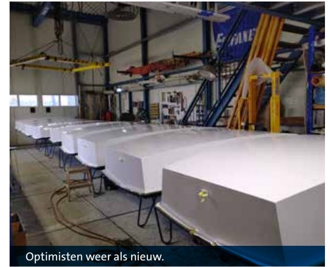
Optimisten weer als nieuw.

Deze winter is er hard gewerkt aan al ons materiaal en de vloot. ■