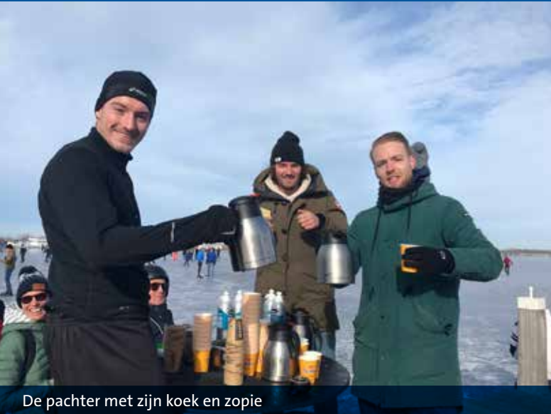
De pachter met zijn koek en zopie