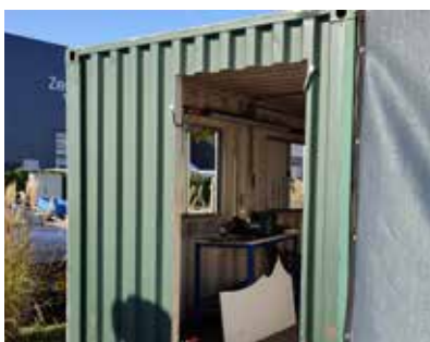
Nieuwe deur kluscontainer.