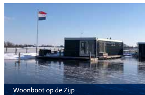
Woonboot op de Zijp