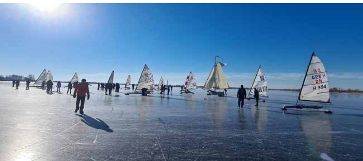
Genieten van schaats- en zeilplezier op de Kaag.