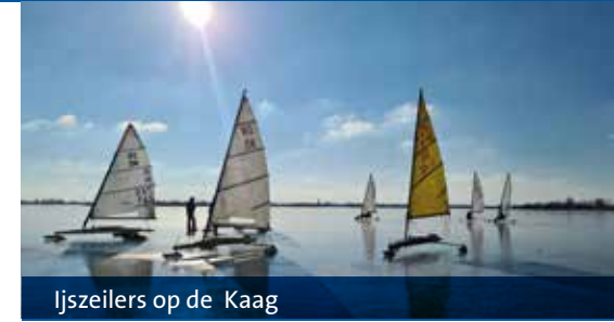
Ijszeilers op de Kaag