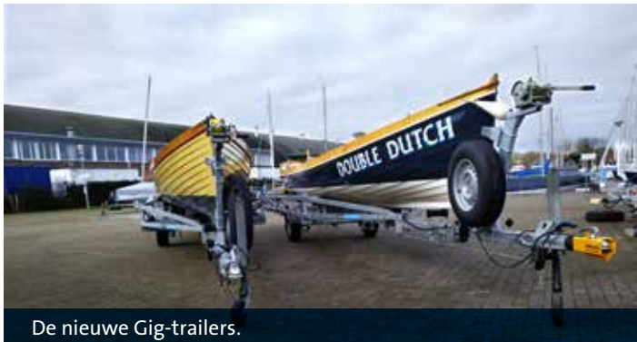
De nieuwe Gig-trailers.