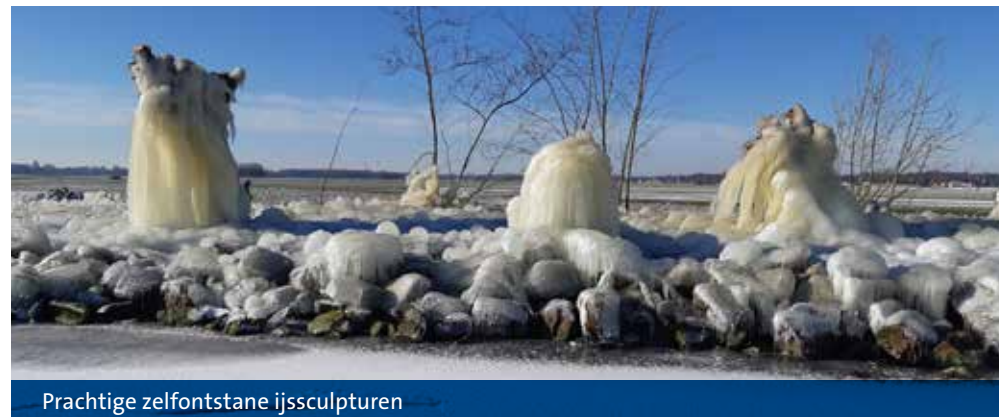
Prachtige zelfontstane ijssculpturen