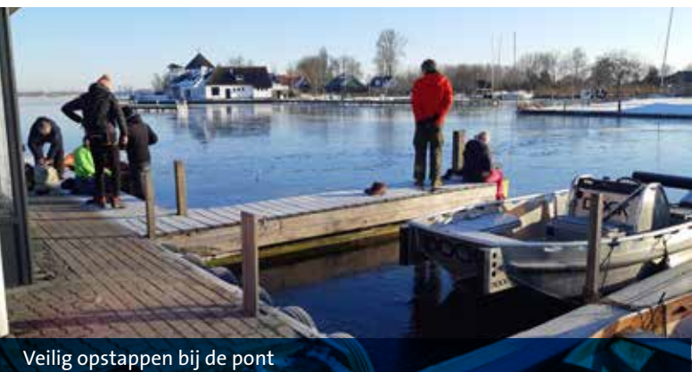
Veilig opstappen bij de pont