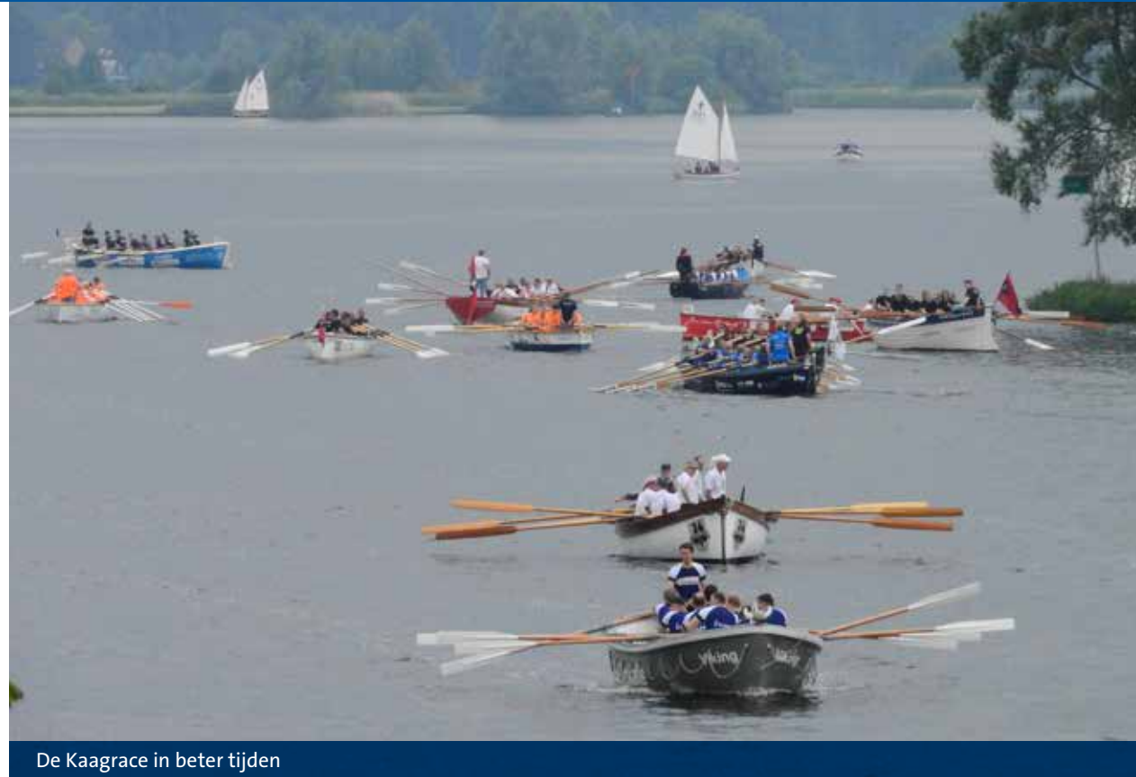
De Kaagrace in beter tijden