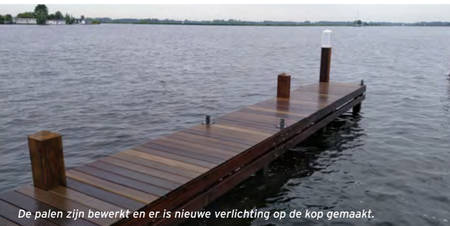
De palen zijn bewerkt en er is nieuwe verlichting op de kop gemaakt.