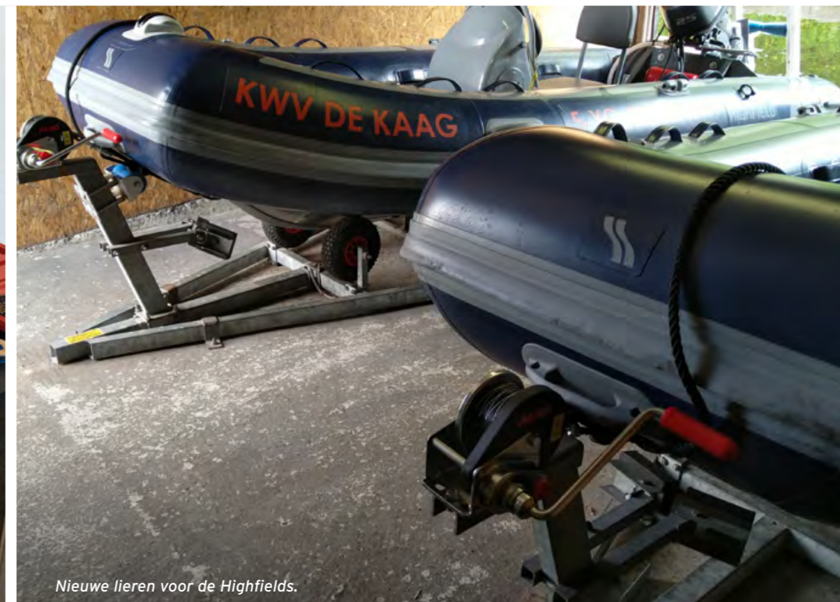
Nieuwe lieren voor de Highfields.