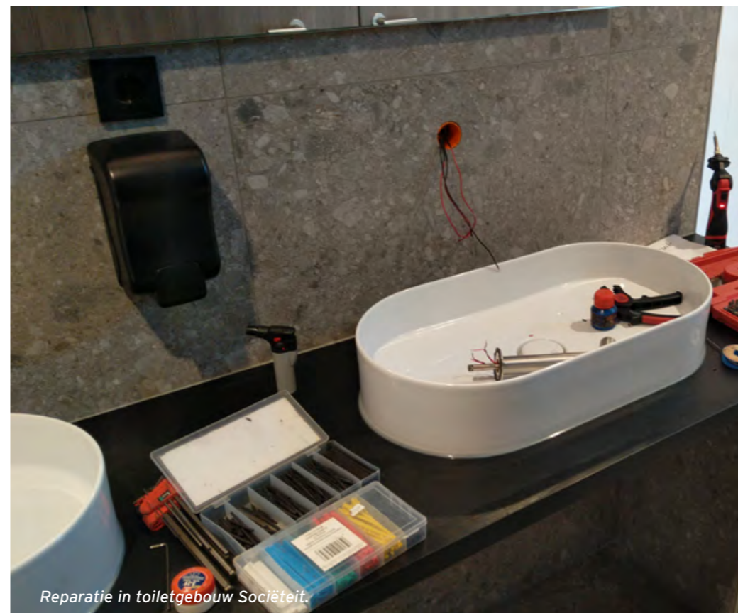
Reparatie in toiletgebouw Sociëteit.