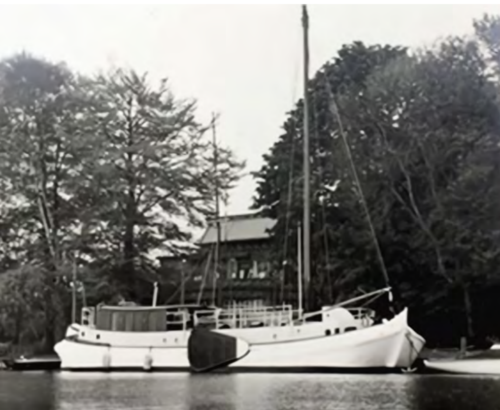
▼ De Tjalk voor de buitenplaats Leevliet met kontje draak 38