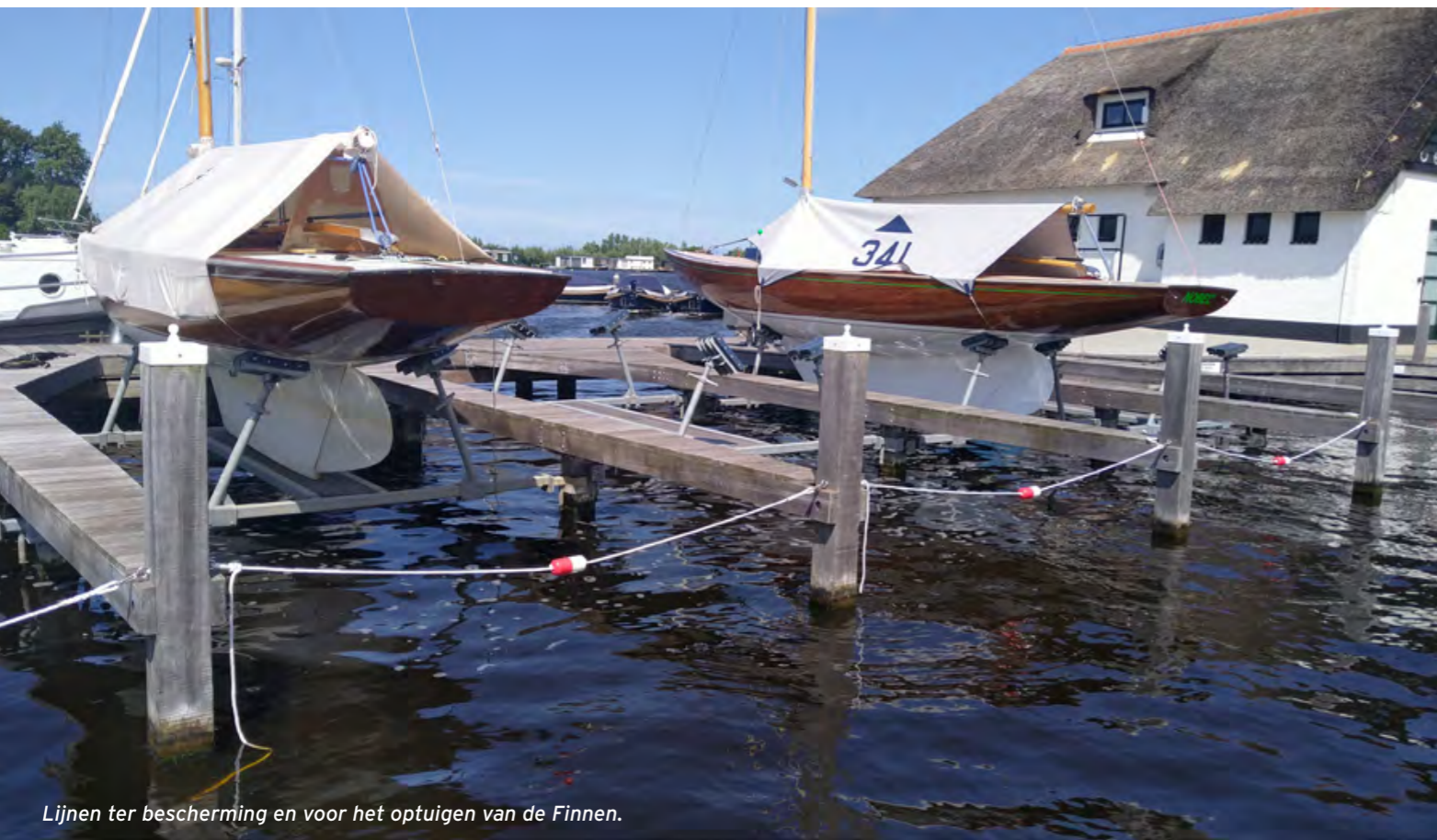
Lijnen ter bescherming en voor het optuigen van de Finnen.