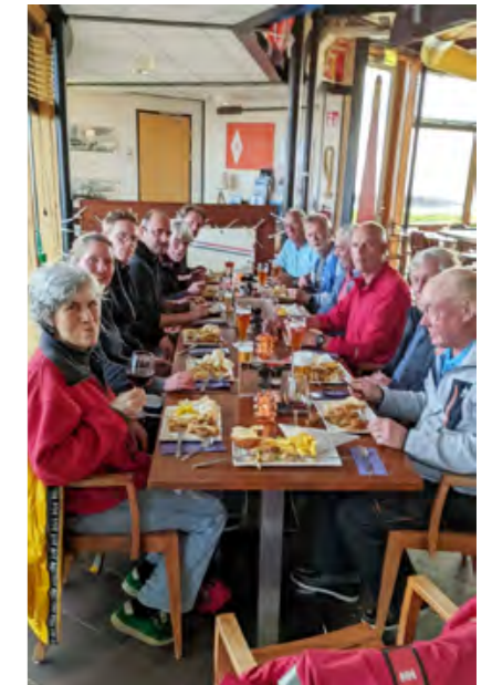
▼ Een toast op de goede aankomst in Den Helder.