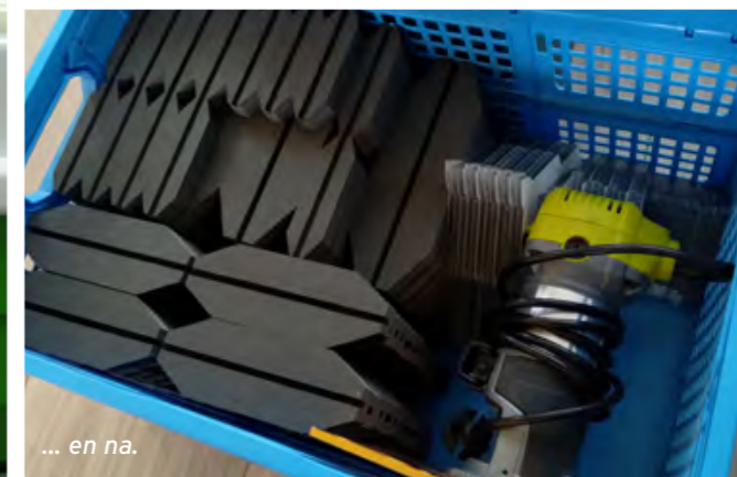
... en na.