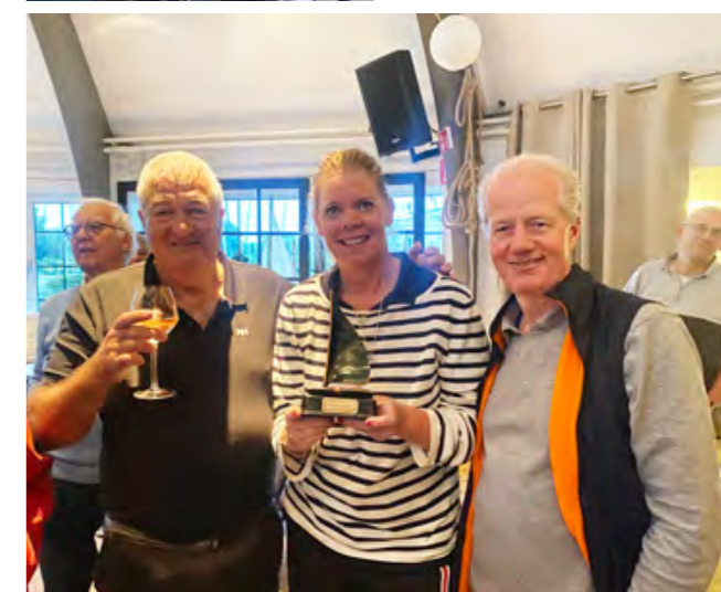
▲ Winnaars 2024