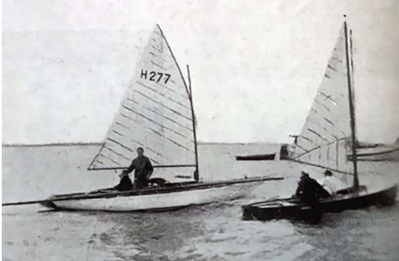
▲ 1941 draak 38 met 277 tuig zeilend terug naar Warmond.

➤ derd mocht worden en die toezegging gebeurde als volgt in augustus 1942.