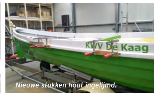
Nieuwe stukken hout ingelijmd.