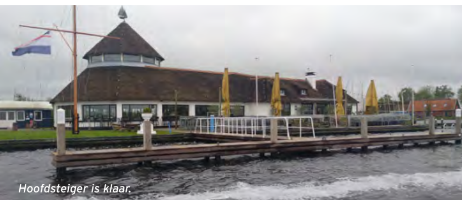
Hoofdsteiger is klaar.