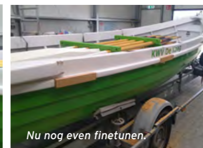
Nu nog even finetunen.