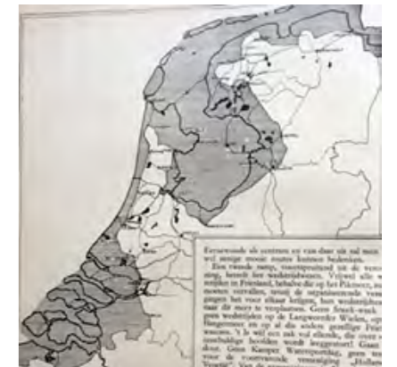
▲ Boven: Vabene in 1939 in België met Paviljoen D'or. Onder: Verboden te varen in donker gebied