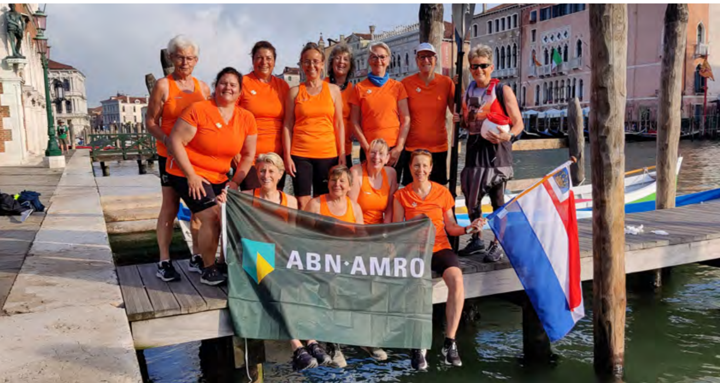
▼ Dank aan de sponsors en KWV De Kaag.

Na een kanonschot vanaf het eiland San Giorgio Maggiore gaan we naar Sant'Elena. Daar gaat de tocht verder richting de eilanden Certosa, Vignole, Sant'Erasmo en San Francesco del Deserto. We kijken onderweg onze ogen uit. Vooral op het eiland Burano, met de gekleurde huisjes, hadden we graag even rondgelopen. Maar we moeten ook de tijd in de gaten houden, want rond 15.00 uur komt in Venetië het gemotoriseerde verkeer weer op gang. Twee keer doen we een wissel met de kajakvaarders, op open water overstappen van kajak naar sloep, en andersom, hadden we op de Kaag al geoefend.