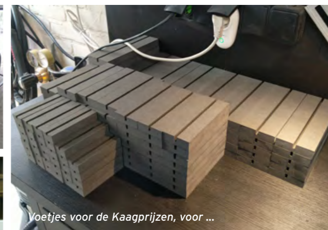
Voetjes voor de Kaagprijzen, voor ...