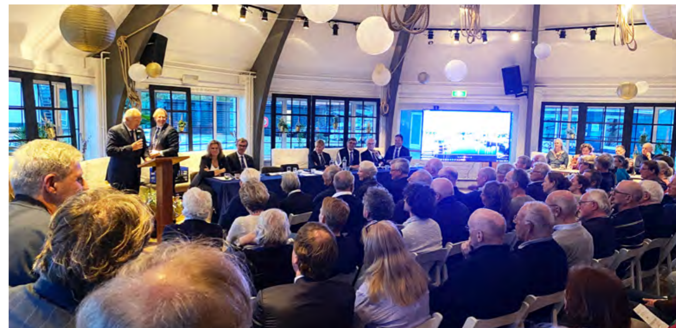
▲ Een volle koepelzaal.